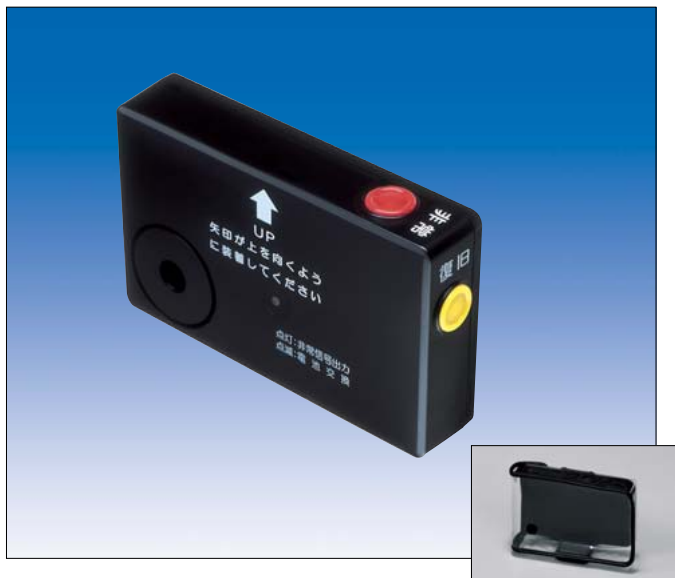
ソフトケース (付属品)