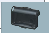
ソフトケース (付属品)